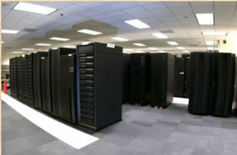
Dit is het BEEST in Brussel waarin alle informatie van de Europese burgers wordt opgeslagen.

De volledig ondemocratische Europese Unie gaat gewoon door met het nemen van besluiten die onze bewegingsvrijheid en privacy nog veel verder aantasten. De werkelijke machthebbers van Europa, die stuk voor stuk zijn benoemd en niet zijn gekozen door de burgers, hebben hun zinnen gezet op 'Project Indect', een toezichts- en controlesysteem dat de overheden niet alleen in staat stelt om voortdurend websites, discussieforums, p2p netwerken en individuele computers te monitoren, maar ook toezichtcamera's kan gebruiken om het gedrag van burgers te observeren. Bovendien bevat Project Indect ook de mogelijkheid om stemmen te analyseren, wat er op lijkt de wijzen dat privé (telefoon-)gesprekken massaal afgeluisterd zullen mogen worden. Het belangrijkste doel van het systeem is het 'automatisch detecteren van bedreigingen en abnormaal gedrag of geweld.' Er gaat al een tijdje het gerucht dat Brussel inmiddels de lang verwachte supercomputer met de opmerkelijke naam B.E.A.S.T. (Brussels Electronic Accounting Surveillance Terminal) in gebruik heeft genomen.