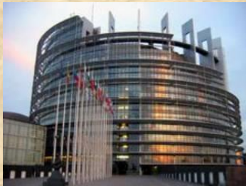
Europese Parlementsgebouw in Straatsburg

Het Europese Parlement bezit sinds 1999 een gebouw in Straatsburg. De ontwerpers van dit gebouw hebben zich laten inspireren door het beroemde schilderij de "Toren van Babel" van de Vlaamse schilder Pieter Bruegel. Dat roept de vraag op of Europa bezig is met dát te herstellen wat de Bijbelse God heeft vernietigd, namelijk het oude Babel van Nimrod uit het Bijbelboek Genesis. Een journalist uit Straatsburg vroeg aan een EU volksvertegenwoordiger: "Waarom is het gebouw van het Europese Parlement een replica van de Toren van Babel?" Zijn reactie: "Waar zij 3000 jaar geleden faalden, dat wil Europa nu afmaken."