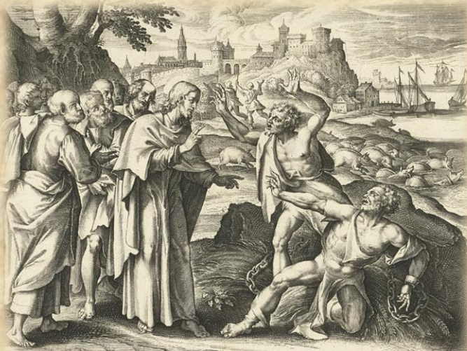
20. Demones rogabant eum dicentes: si ejcis nos, mitte nos in gregem porcorum. Et ait illis, ite. Matth. 8. D'Al. de V. in. 1700. L'abb. de St. Germain. Del. C. de la Roche.

Deze geesten kunnen mensen en dieren overweldigen, of gebruiken en dan kunnen wij spreken over de bezetenen, in bezit genomen door een demoon.