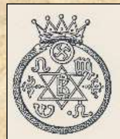
Davidster in het originele embleem van Helena

Waarom wordt het hexagram Ster van David genoemd? Is dit een verwijzing naar David de koning van Israël, of is het een verwijzing naar een andere David? Wanneer het koning David is, is dit dan misschien vanwege het feit dat hij Salomo's vader is? Er is namelijk duidelijk bewijs dat het hexagram het Zegel van Salomo genoemd werd, nadat Salomo de afgoden is gaan vereren, zoals ons verteld wordt in 1 Kon. 11 : 6 – 10. Maar waarom zou die Ster dan iets met David te maken hebben? David was in die tijd immers allang gestorven. Arthur Koestler schrijft dat het hexagram een magisch symbool is, wat terug te voeren is tot de 12 e eeuw na Chr. In die tijd leefde er een Azkenazische Jood, Menahem ben Duji, die zijn volgelingen ervan probeerde te overtuigen dat hij de Messias was. Hij veranderde zijn naam in David al-Roy. Hij zou het beloofde land bevrijden, maar werd vermoord. Vanaf de 13 e eeuw werd het hexagram aan hem toegeschreven, en het verscheen voor het eerst op een Joodse vlag in 1527 na Chr. 1[1] ‘The Encyclopaedia Britannica’ zegt dat het symbool van het hexagram een magisch teken is. De Joodse Kabbala (mystieke richting binnen het Jodendom) heeft het gebruik van de Magen David (Davidster) aangemoedigd als bescherming tegen boze geesten 2[2] , waarmee het de functie van een talisman heeft.