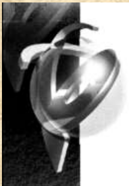
Het EO-logo met het gebogen kruis!

Maar ziet u het EO-logo? De Evangelische Omroep heeft een hele tijd een gebogen kruis in het logo gedragen! Dit is niet toevallig, het wordt allemaal gestuurd door de geestelijke wereld. Want juist in de tijd dat de EO dit logo ging dragen, probeerde deze omroep niet alleen de dialoog met Rome aan te gaan, maar wil zelfs met Rome samenwerken (zie bijv. 'Mijn Visie' van Wim Grandia in Visie nr. 34 1999)!