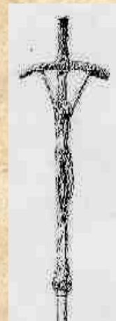
Het gebogen crucifix. Uit literatuur nr.: 5.