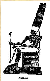
Uit literatuur nr.: 1.

Het teken van het kruis is echter Babylonisch van oorsprong. Het was reeds een religieus symbool voor de bevolking van Babylonië. Het komt van het Tau-teken, wat komt uit de mystiek van de Chaldeeën (Babyloniërs) en de Egyptenaren. Nimrod , de stichter van Babylon, zou van zijn vrouw Semiramis een zoon gekregen hebben: Tammuz .