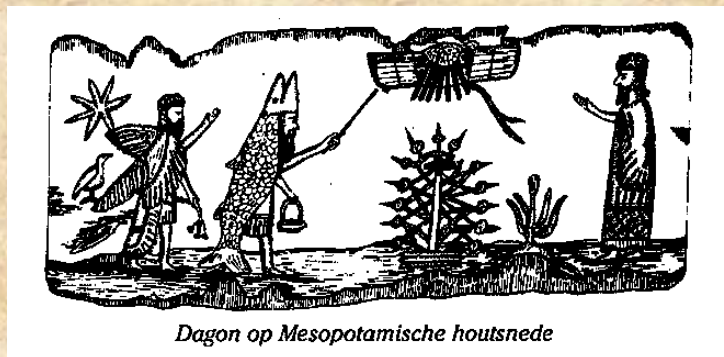
Dagon op Mesopotamische houtsnede

Heeft u wel eens op de mijter van de Paus gelet? Jezus Christus en de apostelen hebben zo'n mijter nooit gedragen! De Joodse mijter, die Aäron en de hogepriesters droegen, was totaal iets anders: een tulband! De mijter die de Paus draagt is onbekend in de Schrift! Waar kwam dit type mijter vandaan? Eén van de afgodsvormen, waarop Babylons Nimrod onder de andere volken bekend is geworden, is de vis. Hij is bekend geworden als Dagon, de vis-god. Vaak afgebeeld als half man, half vis. Een andere afbeelding van Dagon vindt u hieronder: