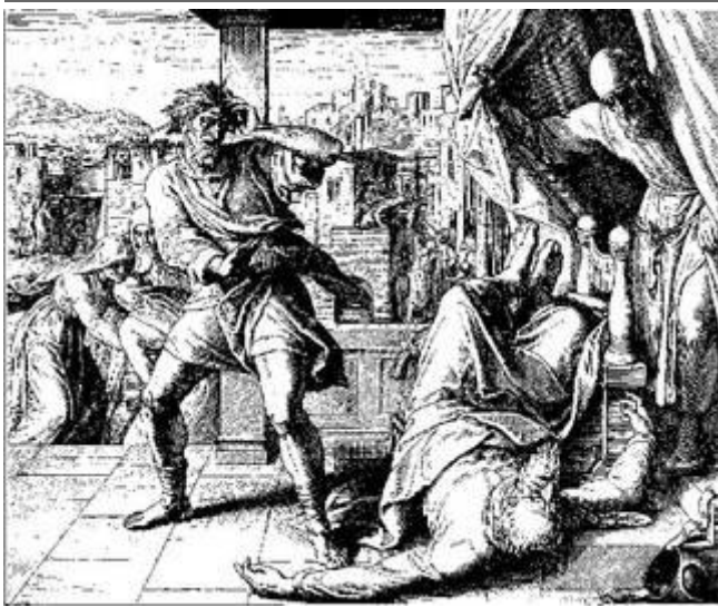
De hogepriester Eli viel achterover van zijn stoel naast de poort, en brak zijn nek en stierf .

(1 Samuël] 4:18). Het achterover vallen is dus geen zegen, maar vindt juist plaats in geval van het bestraffen of het opzij zetten van Gods tegenstanders, zoals bijv. in Genesis] 49:17; de berijder van het paard achterover stort en in (Jesaja 28:13) de leiders van Jeruzalem achterover struikelen en te pletter zullen vallen. Ook in Nieuwe Testament komen wij het achterovervallen tegen bij de soldaten die kwamen om Jezus te arresteren: “Toen Hij zei: ‘Ik ben het,’ deinsden ze achteruit en vielen op de grond! ” (Johannes 18:6). Met uitzondering van deze gevallen van het bestraffen van Gods tegenstanders en een aantal gevallen waarin mensen demonisch gebonden zijn en daardoor achterovervallen terwijl de demonen worden uitgedreven, noemt de Bijbel nergens een verband tussen vervuld zijn met de Heilige Geest of genezing en het “vallen in de geest”.