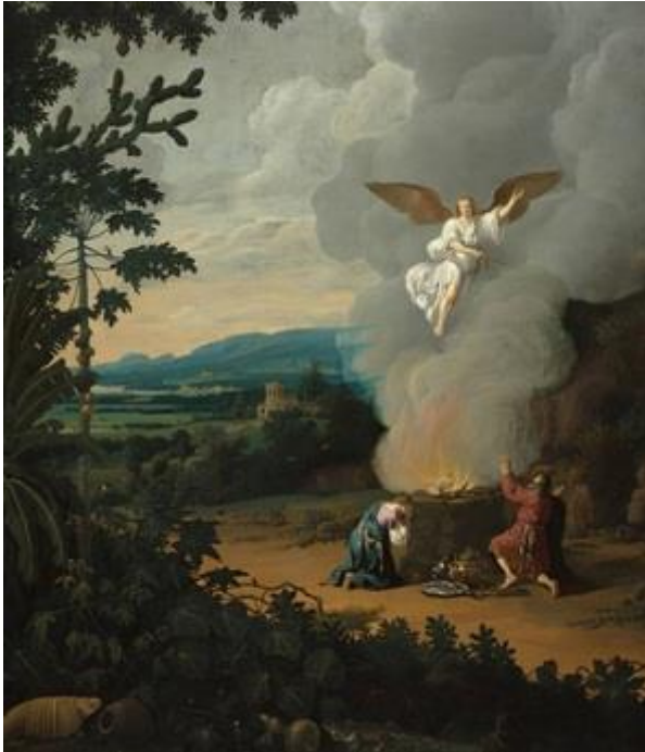
Toen Manoah en zijn vrouw de Engel des Heren zagen, vielen zij op hun aangezichten ter aarde.

de Nieuwe Bijbelvertaling heeft men voor het werkwoord “vallen” gekozen, maar dan wel met een nadere toelichting: “Ze vielen op hun knieën en bogen diep voorover.” En zoals we inmiddels gewend zijn staat er in de NBG-vertaling: “...wierpen zij zich op hun aangezicht ter aarde” .