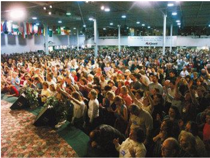
De Toronto Blessing was de golf die voorafging aan de Lakeland Revival en waarbij dezelfde principes betrokken zijn.

De Toronto Blessing was de golf die voorafging aan de Lakeland Revival en waarbij dezelfde principes betrokken zijn. Wat zijn de tekenen van een Ontwakende Kundalini? Kort gezegd, en volgens de klassieke literatuur, kunnen de tekenen van een Ontwakende Kundalini gegroepeerd worden in: mentale, vocale en fysieke tekenen. Mentale tekenen kunnen visioenen zijn die variëren van extatische gelukzaligheid tot verschrikkelijke angstigheid. Vocale tekenen kunnen spontane vocale expressies zijn die variëren van zingen of reciteren van mantra's tot het maken van allerlei dierlijke geluiden, zoals grommen of kwetteren. Fysieke tekenen kunnen zijn trillen, schokken en spontaan Hatha Yoga houdingen aannemen en Pranayama's. Vanuit een meer subjectief perspectief kunnen de eerder prettige ervaringen, die geassocieerd worden met een Ontwakende Kundalini, de volgende zijn: golven van gelukzaligheid, perioden van verrukking, glimpen van transcendentaal bewustzijn.